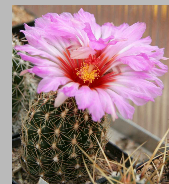
Thelocactus bicolor subsp. schwarzii